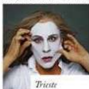
Annie Leibovitz / Meryl Streep, NYC (1981), 2014 di Sandro Miller.

FINO AL 5 NOVEMBRE, SUL PORTALE CULTURALE DEL COMUNE DI PALERMO E SULLA PAGINA DI ASYLUM FANTASTIC FEST