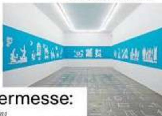
Arbre au Soleil et la Lune au Jungle d'Amazonas (L'eau) (2019) di Yona Friedman.

MAGAZZINO DELLE IDEE, FINO AL 31 GENNAIO. MAGAZZINODELLEIDEE.IT