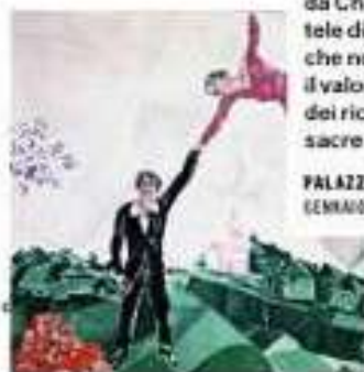
La passeggiata (1917-1918) di Marc Chagall.

LA TRIENNALE, FINO AL 16 APRILE TRIENNALE DDB