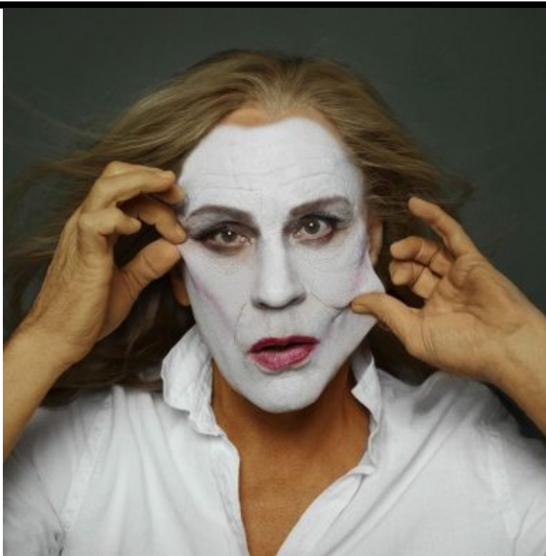
Annie Leibovitz / Meryl Streep, NYC (1981), 2014 © Sandro Miller / Courtesy Gallery FIFTY ONE, Antwerp