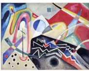
Venezia: "Kandinova e le Avanguardie. Puntata, linea e superficie"