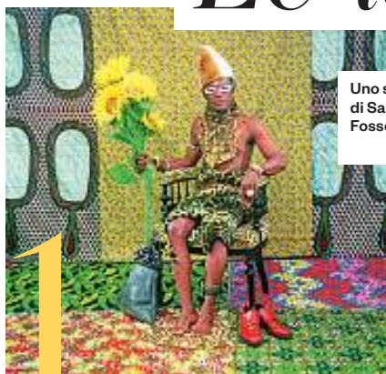
Uno scatto di Samuel Fosso.