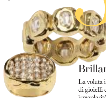
Anelli in oro e diamanti di Patcharavipa.