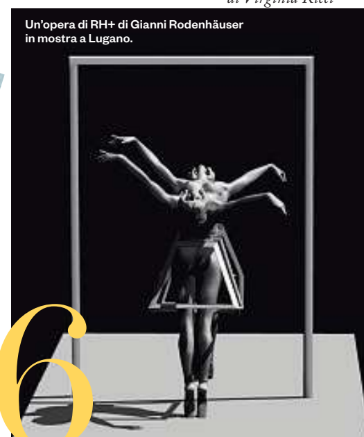
Un'opera di RH+ di Gianni Rodenhäuser in mostra a Lugano.

In Tirolo, le 23 strutture dei Familienhotels Südtirol offrono svago e cultura per i più piccini. Oggi ancora di più con la "Academy" che forma assistenti pedagogici esperti, per stimolare la loro creatività ( familienhotels.com ).